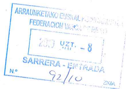
ROKE ALDAY DEL VALLE DE LERSUNDI IDAZKARIA